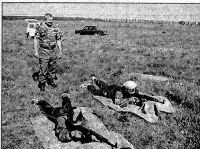
Ребята учатся стрелять.